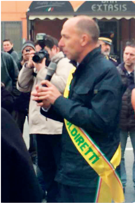
Il Presidente Provinciale dei Coltivatori Diretti

antichi. Il corteo è poi ripreso fino alla nuova sede della Fondazione "IKAROS", a cui va un sincero ringraziamento per l'ospitalità e la collaborazione, dove con la benedizione del Vescovo si è proceduto al taglio del nastro della nuova area Food.